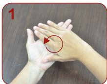
Putar di telapak tangan