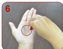
Ujung jari berputar