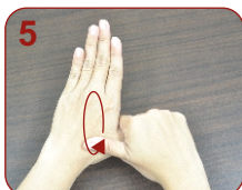
Ibu jari secara berputar