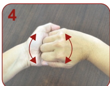
Punggung jari sampai sela-sela